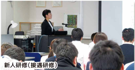
新人研修(接遇研修)