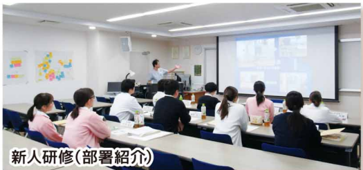
新人研修(部署紹介)