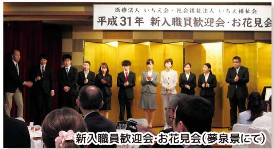
新入職員歓迎会・お花見会(夢泉景にて)

今春、当院に9名の新入職員を迎えました。 フレッシュな新入職員の活躍にご期待ください。