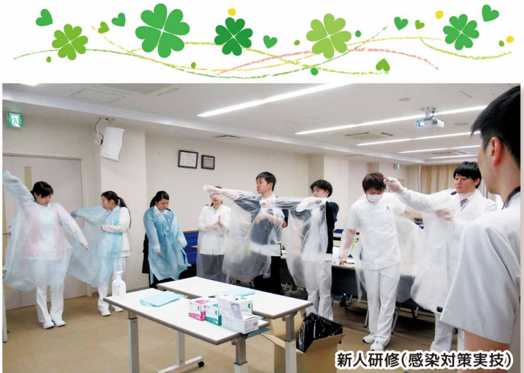
新人研修(感染対策実技)