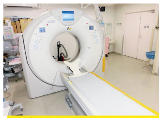
80列マルチスライスCT

お問い合わせは、洲本伊月病院 健診センターへ フリーダイヤル 0120-185-150