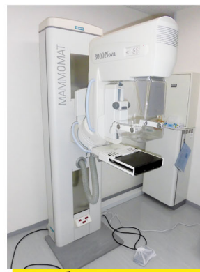
マンモグラフィー