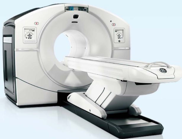
Discovery IQ (GE社製)