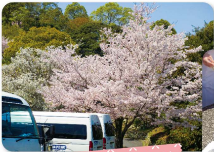
恒例のお花見ピクニック